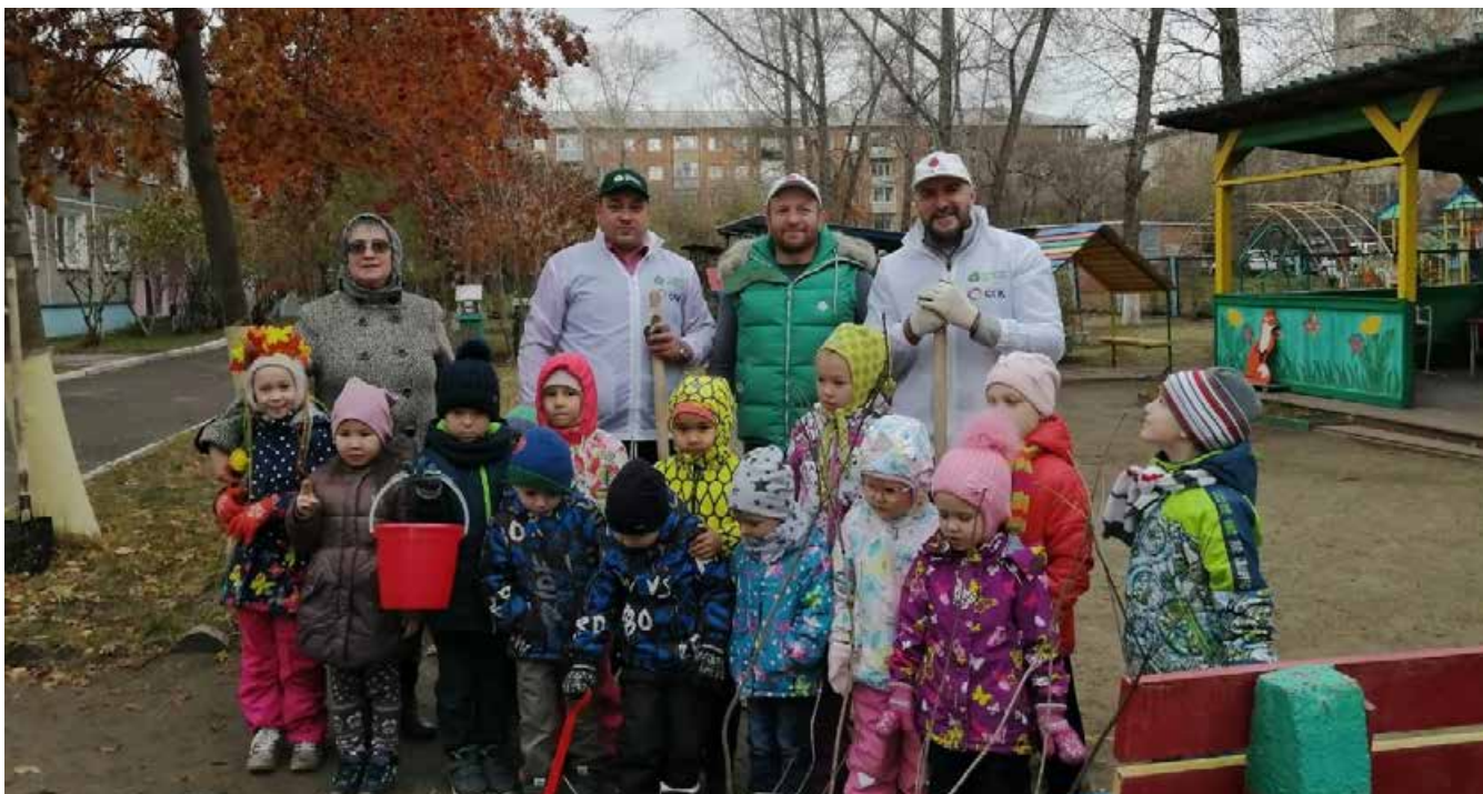
В одном из детских садов города Красноярск Совет отцов высадил аллею сирени