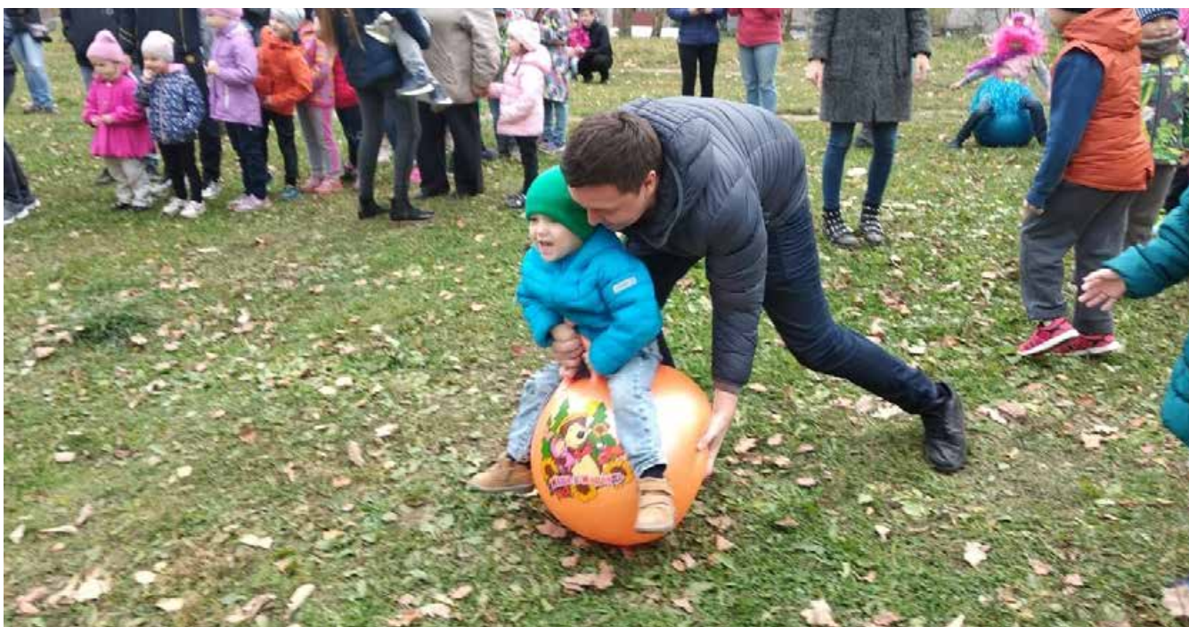
Дворовый праздник отцов и детей - новая традиция смоленских отцов , заложённая в День отца