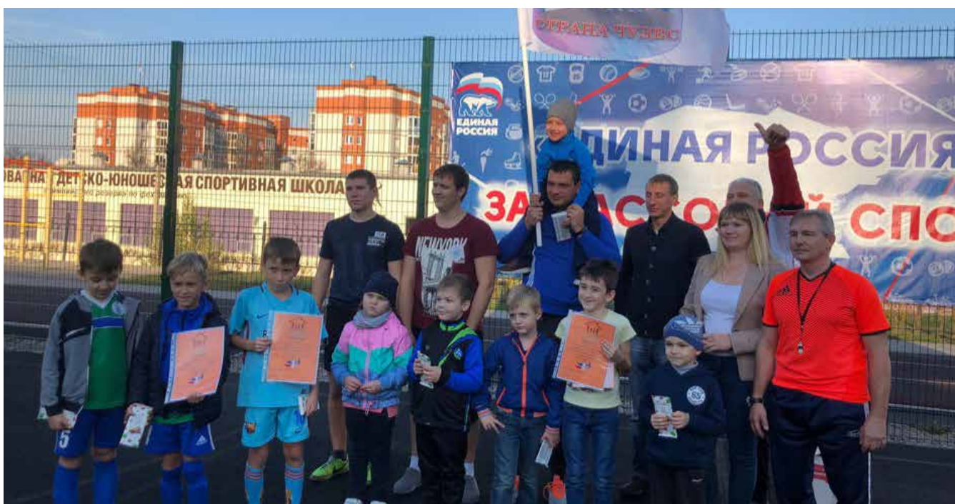
Совет отцов Курской области провёл футбольный турнир на Кубок Уполномоченного по правам ребёнка