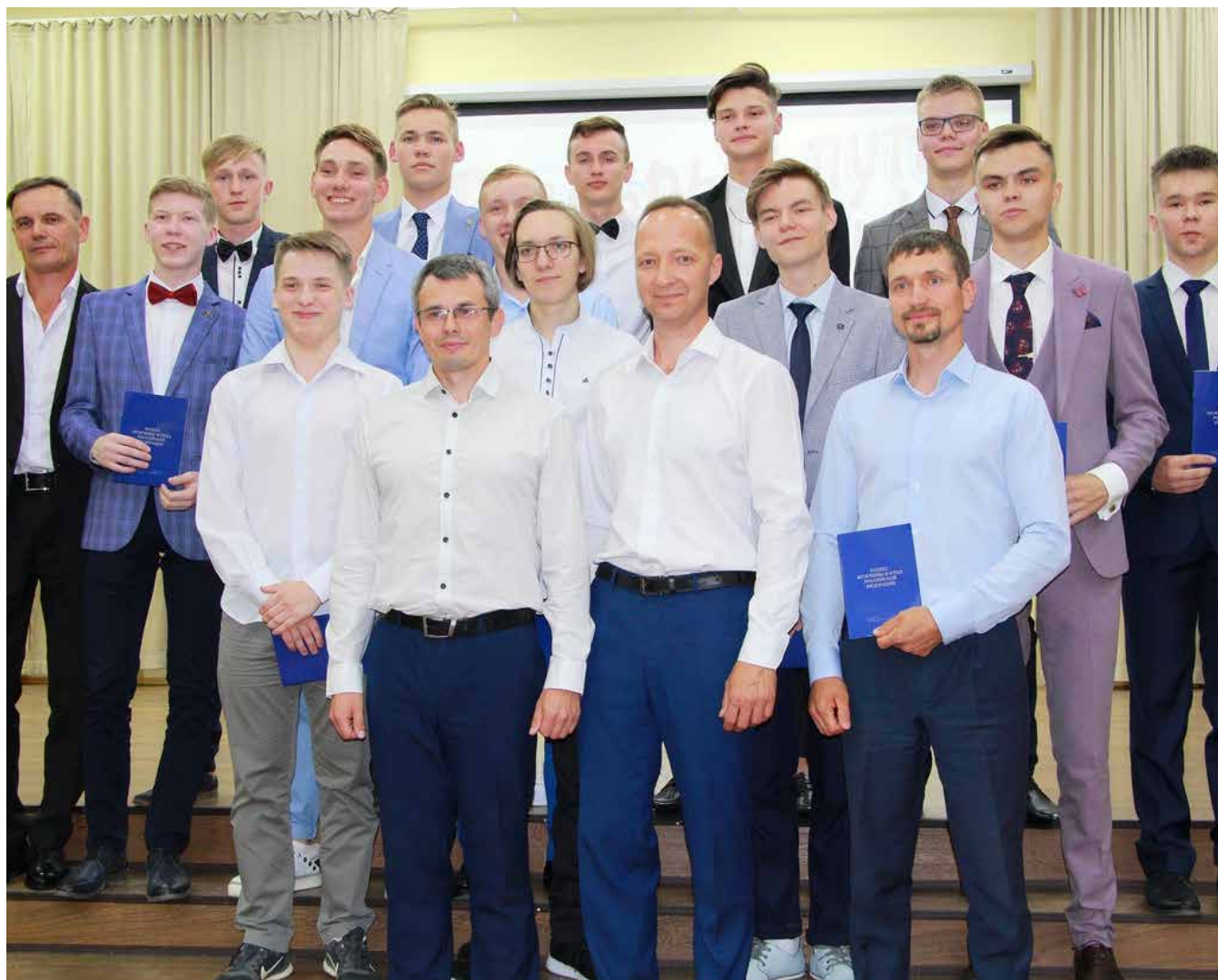
Вручение Кодекса выпускникам МБОУ «СОШ № 17» г. Новочебоксарска Чувашской Республики

КОДЕКС ВРУЧАЕТСЯ ВЫПУСКНИКАМ ШКОЛ ВМЕСТЕ С АТТЕСТАТОМ.