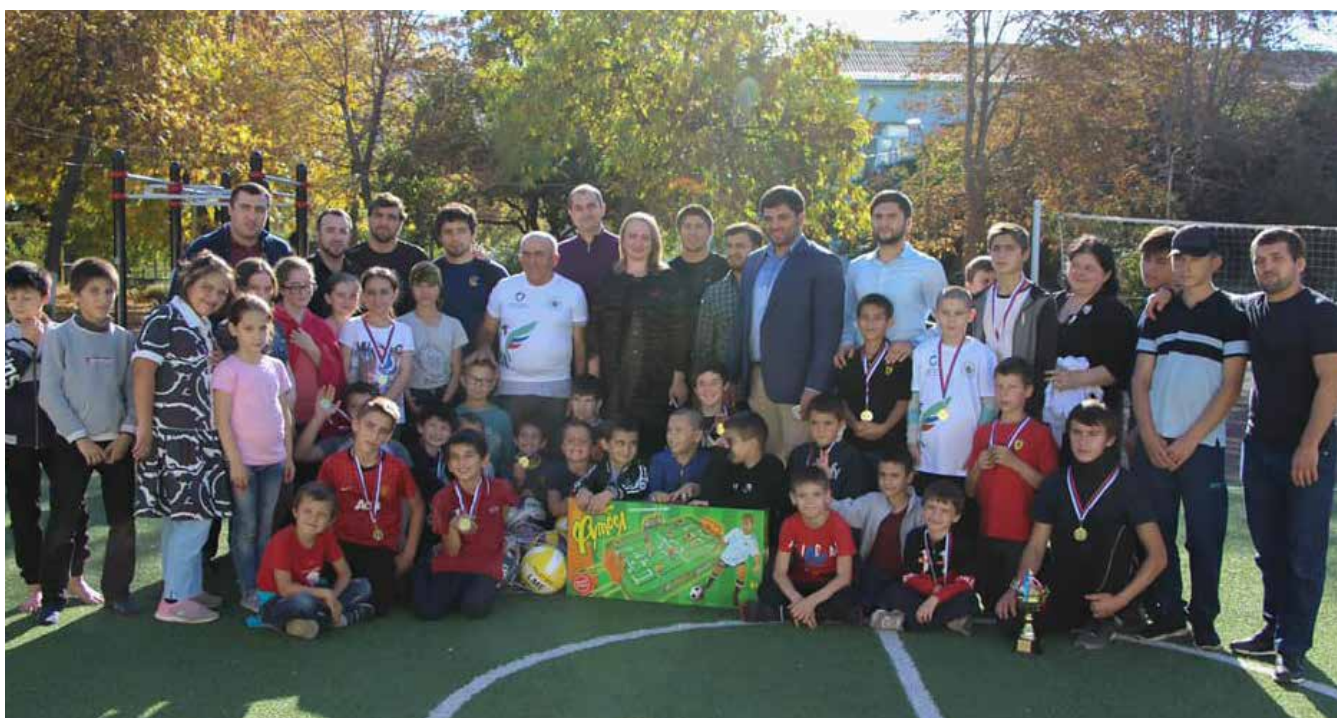
Совет отцов Республики Дагестан организовал поездку в социально-реабилитационные центры для несовершеннолетних детей с программой спортивного наставничества